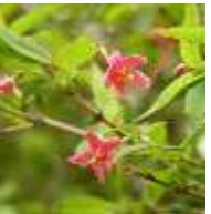
ヤマウグイスカグラ

別名：ウグイスノキ。名前の由来は、ウグイスガクレが転訛したとの説もあるが、定説はない。本種は全体に毛があるが、毛がないものをウグイスカグラという。落葉低木。 (スイカズラ科)