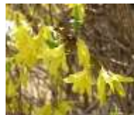
チョウセンレンギョウ

花は香水の原料に、樹皮・枝葉からはごぶし油をとる。花の時期にはタムシバとの区別がなかなかむずかしいが、花のすぐ下に小形の葉があることで区別できる。